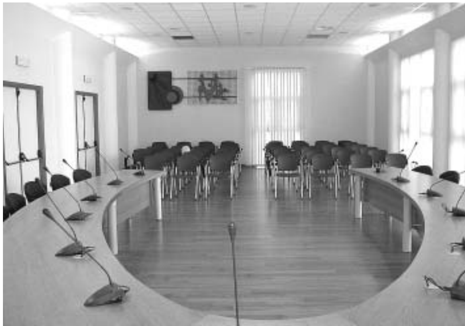
La sala consiliare

L'edificio ristrutturato ha ospitato gli scolari di alcune classi delle scuole elementari sino al termine dell'anno scolastico 2000-2001. Nella primavera del 2001 è stato affidato l'incarico per la redazione del progetto che abbiamo approvato nella sua versione esecutiva alla fine dell'anno. I tempi tecnici necessari allo svolgimento della gara d'appalto hanno fatto sì che i lavori venissero affidati all'impresa vincitrice nel mese di marzo del 2002 con scadenza degli stessi nel mese di giugno del 2003. Nel corso dei lavori si è manifestata l'esigenza di intervenire per variare parzialmente il progetto al fine di mascherare per quanto possibile gli antiestetici ma necessari filtri dell'acquedotto che, dalla posizione originale, erano poi stati previsti sulla via XXV aprile. La soluzione adottata, cioè l'interramento totale dei serbatoi, ha con-