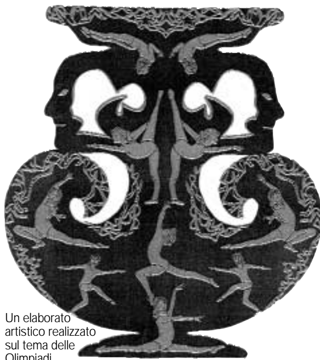
Un elaborato artistico realizzato sul tema delle Olimpiadi

"Impegno a valorizzare la cultura europea"