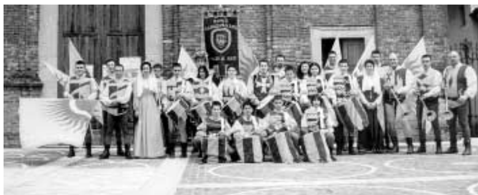
Gli sbandieratori di Asti

La settimana di iniziative si è svolta comunque in modo piacevole con una temperatura decisamente estiva. Cominciando dalla Ciclobussero che ha riscosso un notevole successo e che sicuramente ripeteremo il prossimo anno, l'organizzazione della proloca ha regalato a tutti i partecipanti numerosi premi e medaglie ricordo. Le serate in corte del Tram come sempre coinvolgenti per l'atmosfera e la capacità dell'Ass. Anziani a sfornare piatti succulenti a cui i cittadini rispondono