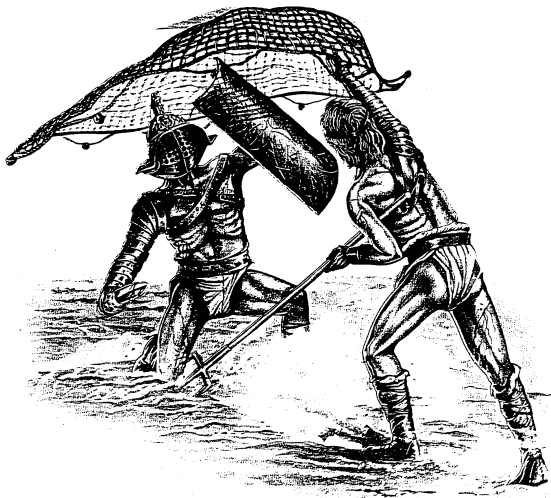
NAME: GLADIATORS' FIGHTING WHEN: DURING THE DAY WHERE: AT THE COLOSSEO