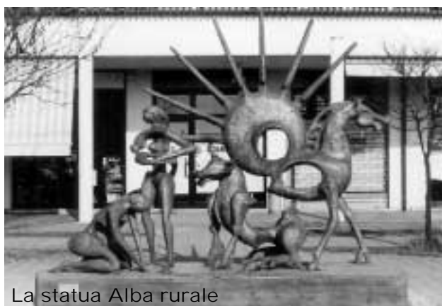
La statua Alba rurale

Sì, e credo di sapere anche il perché... Con il tempo si inflazionò il territorio di mostre con scarso va-