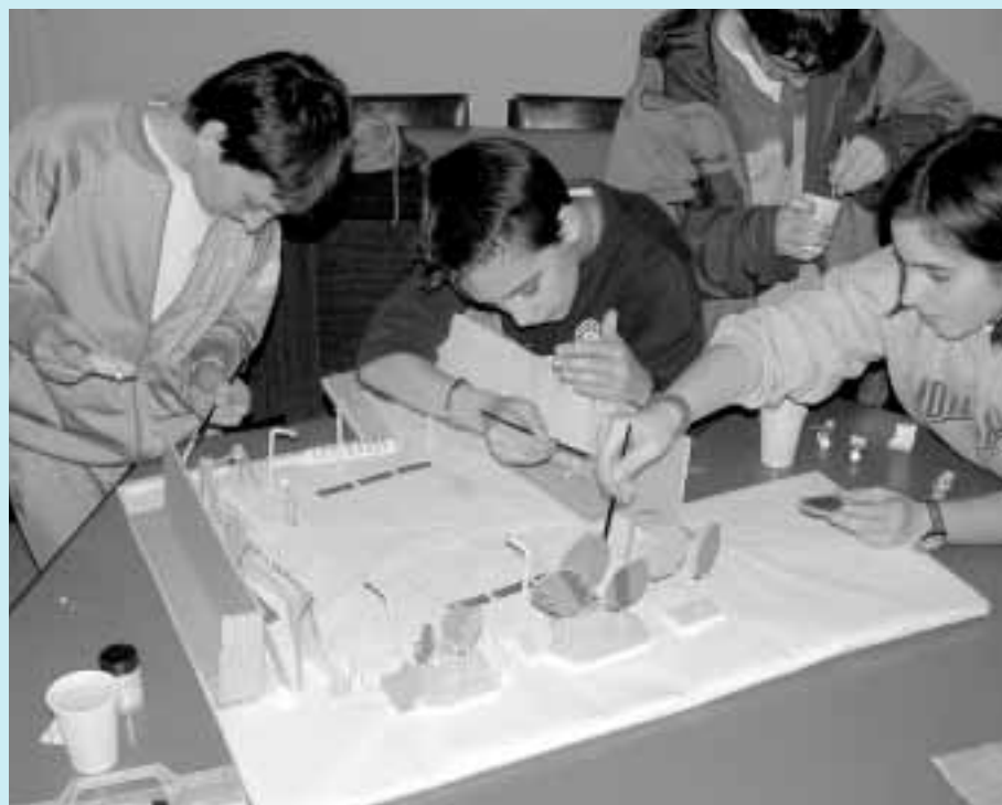
I ragazzi del CCR lavorano al plastico della nuova piazza del Municipio

L'operato del gruppo promotore ha permesso, in data 26 maggio (festa della scuola media) e in data 9 giugno (squadra), che i ragazzi gestissero direttamente momenti di gioco e attività sul tema del CCR.