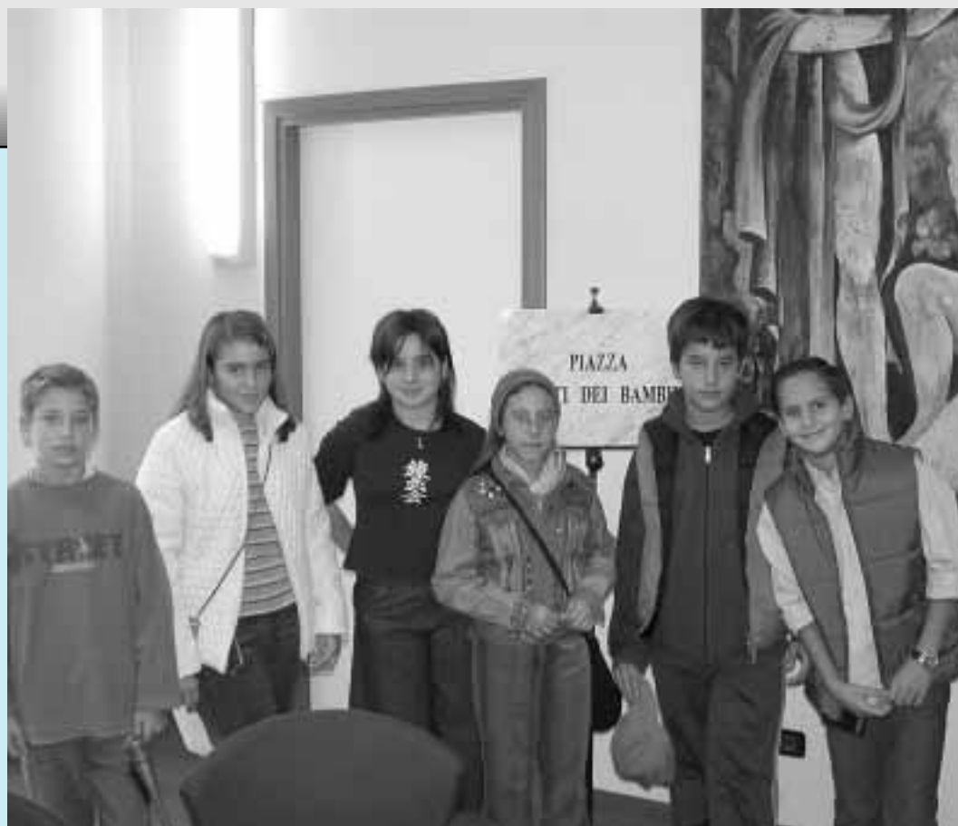
I ragazzi del CCR scoprono la targa della nuova piazza del Municipio